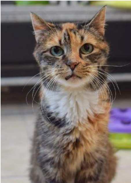
Foto: Maudi na behandeling

Poes Maudi zoals ze officieel heet is al een poosje in het asiel. Ze is op 17 januari binnengekomen, broodmager. Opvallend detail: haar tongetje hing naar buien. Wat bleek, heel haar bekje was ontstoken terwijl de slijmvliezen juist bleek waren. Door alle vlooien die bloedarmoede hadden veroorzaakt. Een verdrietig katje dus. De tegenactie werd ingezet met antibiotica in meervoud en natuurlijk een behandeling tegen vlooien en wormen. Ook volgde een gebitsbehandeling met als resultaat dat Maudi precies nog twee tandjes over heeft. Je kunt het haast niet voorstellen maar ondanks alle ontstekingen is Maudi gek op eten: gemalen brokjes, aangemengd met wat lauw water en zachtvoer. Langzaam ging het beter en werd het ook weer een actief katje dat zich reuze vermaakt in de kattenkamer. Met de ontstekingen is het een wankel evenwicht, momenteel is het redelijk onder controle met om de dag een pilletje Prednoral en 2-wekelijkse controle bij de dierenarts. Duimt u mee voor een goede toekomst voor Maudi?